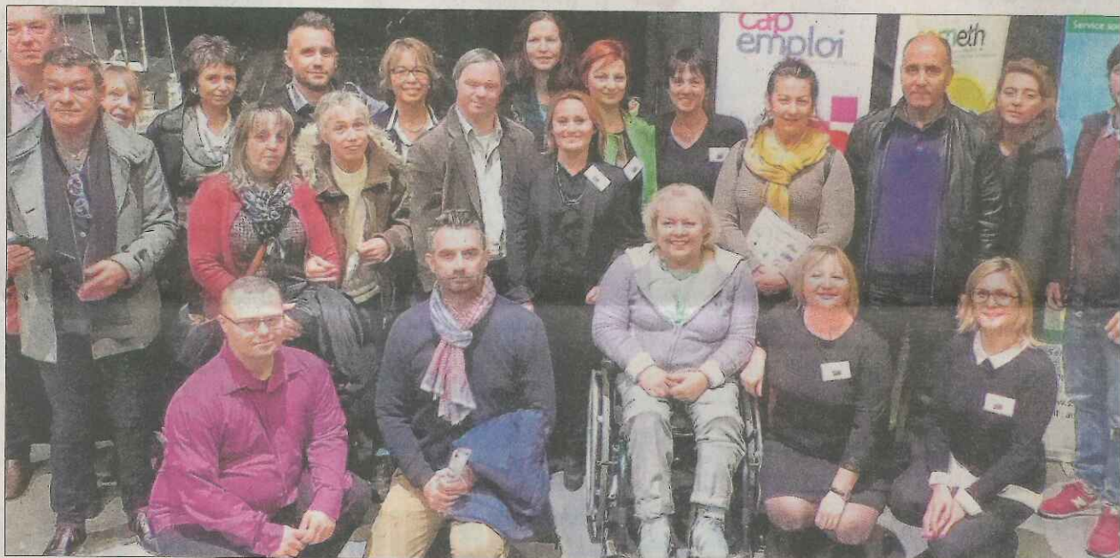
Deux cents spectateurs s'étaient réunis à Agroparc pour assister à la première édition du festival.

Les neuf courts-métrages représentés de vraies si-